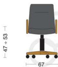
CLS 104 Poltrona direzionale con braccioli senza oscillante. Directional armchair without tilting.