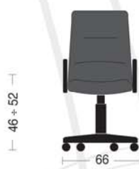
CL 91 Poltrona presidenziale con braccioli e oscillante mov. 11. Presidential armchair with mov. 11 tilting.