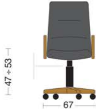
CLS 101 Poltrona presidenziale con braccioli e oscillante mov. 11. Presidential armchair with mov. 11 tilting..