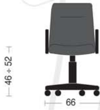
CL 94 Poltrona direzionale con braccioli senza oscillante. Directional armchair without tilting.