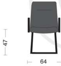
CL 98 Poltrona attesa fissa con braccioli. Fixed armchair.