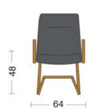
CLS 108 Poltrona attesa fissa con braccioli. Fixed armchair.